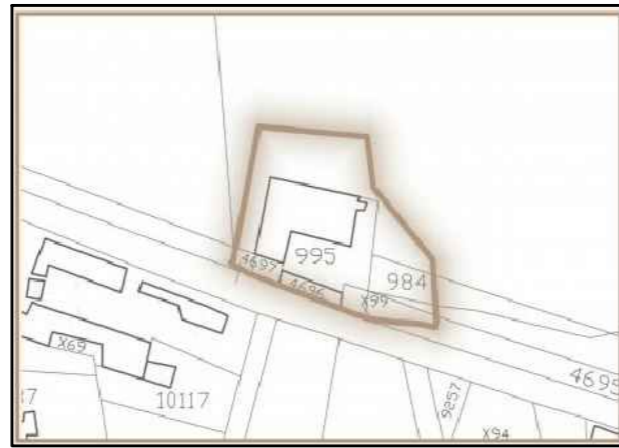
NUOVO CATASTO DEI TERRENI